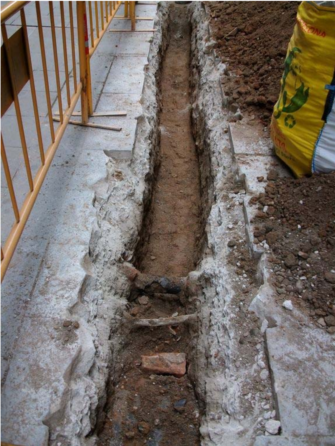
Vista de la rasa al carrer de Boters 1, on es va afectar únicament un rebliment d'argiles i sorres contemporànies.