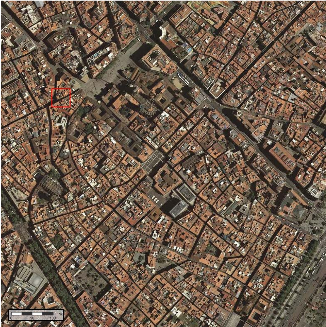
Fotografia aèria l'entorn de la intervenció, amb la situació de l'àrea on es va excavar la rasa.