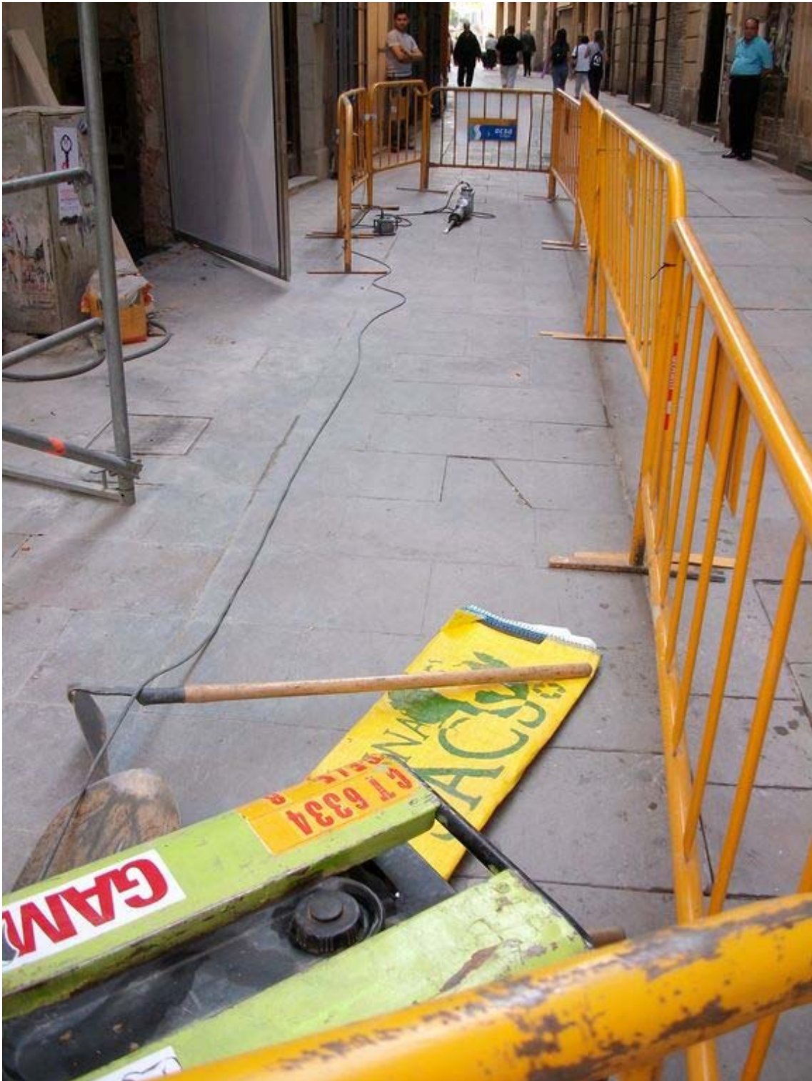
Vista de l'espai on es va excavar la rasa objecte del present seguiment